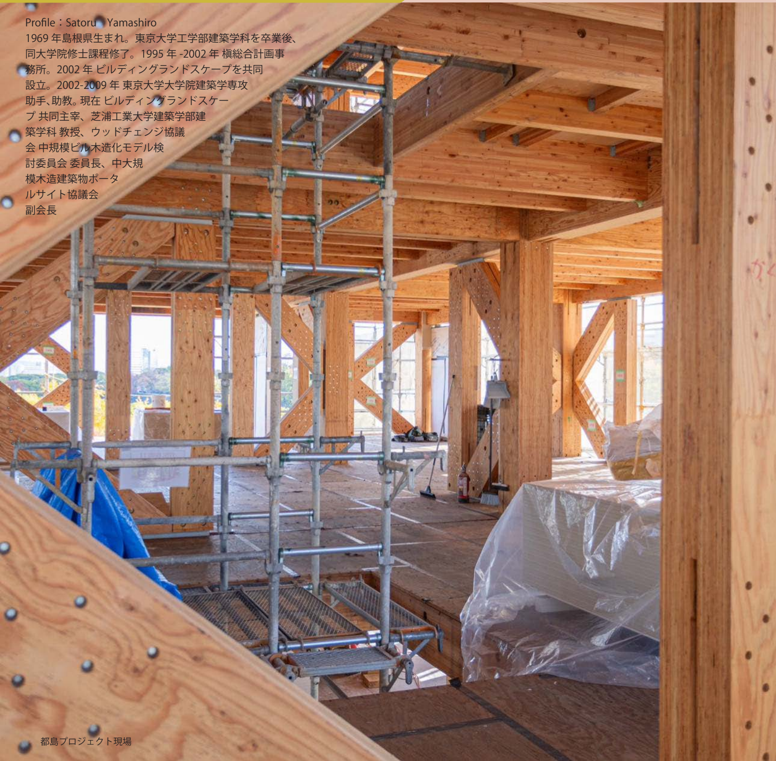
都島プロジェクト現場

1969 年鳥根県生まれ。東京大学工学部建築学科を卒業後、同大学院修士課程修了。1995 年 -2002 年 楨総合計画事務所。2002 年 ビルディングランドスケープを共同設立。2002-2009 年 東京大学大学院建築学専攻 助手、助教。現在 ビルディングランドスケープ 共同主宰、芝浦工業大学建築学部建築学科 教授、ウッドチェンジ協議会 中規模ビル木造化モデル検討委員会 委員長、中大規模木造建築物ポータルサイト協議会 副会長